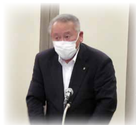
副議長の高橋町長(徳島県藍住町)