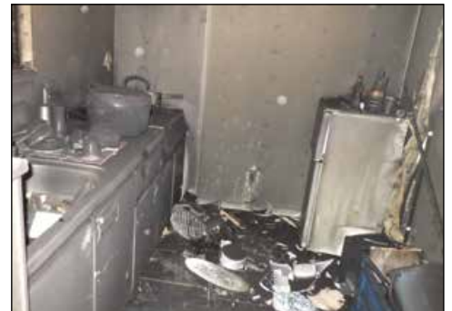
火災現場の様子 (上：洋室 下：キッチン)