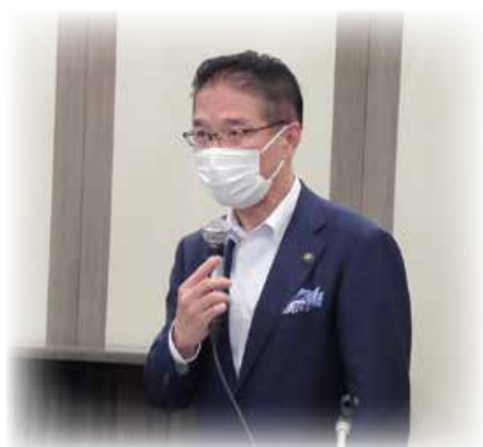
議長の前葉市長(三重県津市)