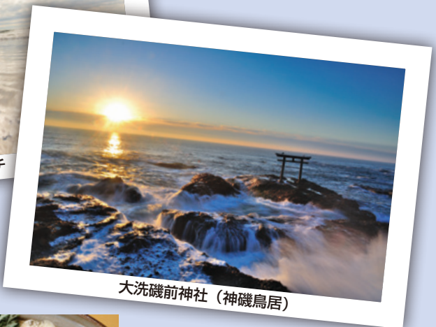
大洗磯前神社(神磯鳥居)