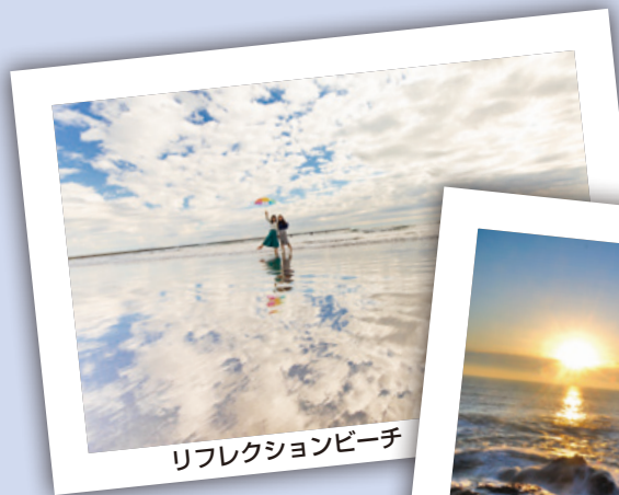
リフレクシオンビーチ