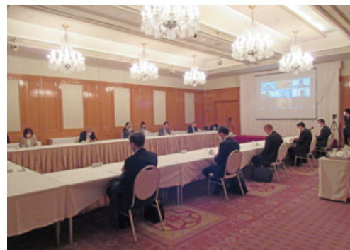
第2回定例理事会の様子

公益社団法人全国公営住宅火災共済機構財産管理規程第3条第3項に基づく元本保証のない金融商品の取得及び運用報告について