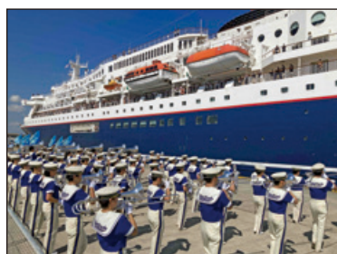
マーチングバンド 「BLUE-HAWKS」