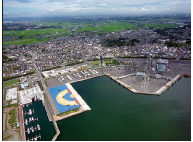
フェリーポートと街並み

日本初のユニバーサルビーチとして知られる大洗サンビーチ、日本トップクラスの大型水族館などの観光施設、あんこう鍋、岩がき、ハマグリ、生しらすなど極上の美味食材、近年はリフレクシオンビーチや神磯鳥居といった、「映える」スポットなどの魅力的な観光資源がクローズアップされております。また、国史跡に指定された磯浜古墳群、ラムサール条約登録湿地帯の潤沼、首都圏と北海道を結ぶカーフェリーの拠点である大洗港など、多様な資源と魅力を兼ね備えた年間400万人を超える観光客が訪れる茨城県屈指の観光都市です。